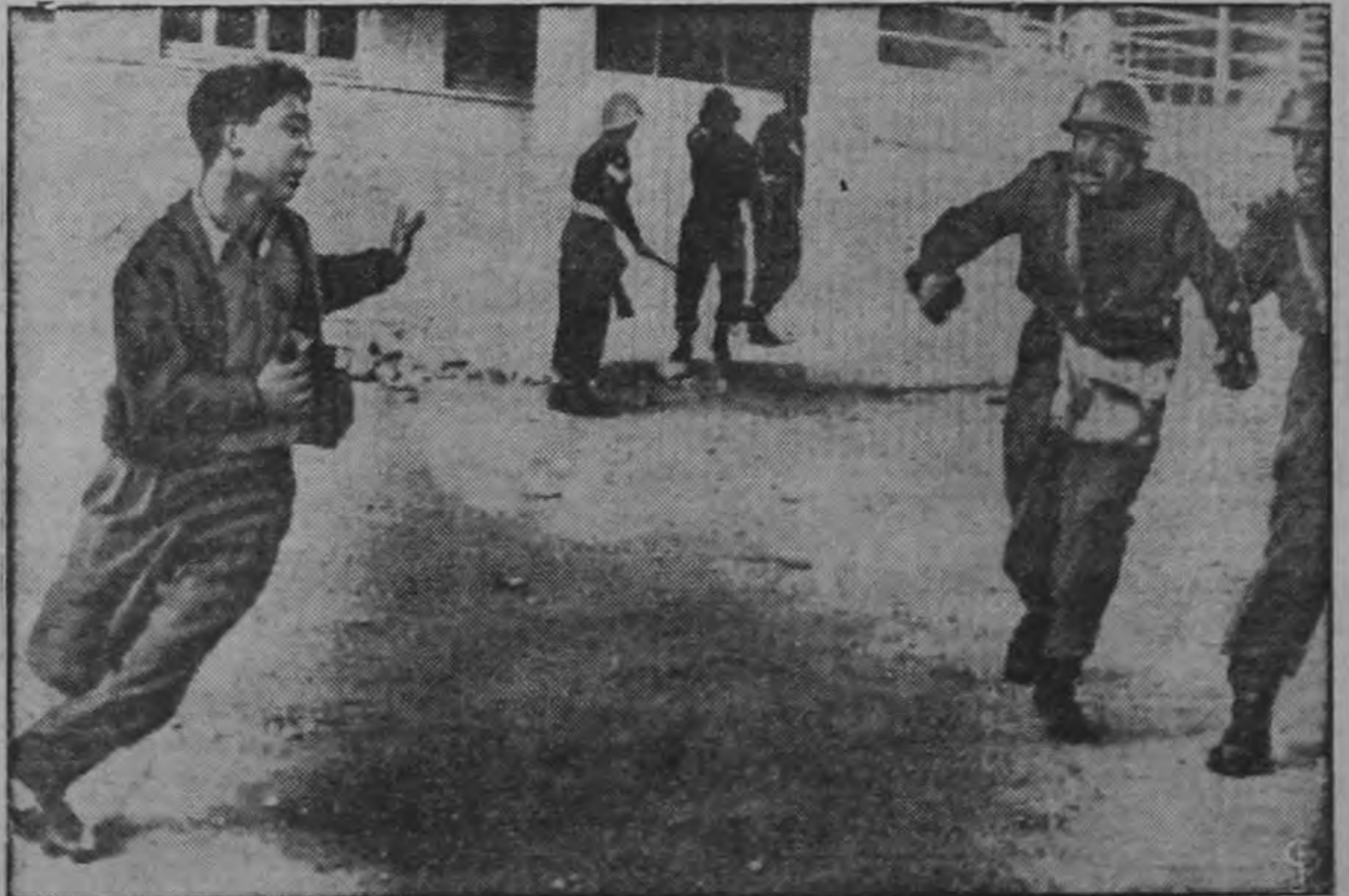
Un joven estudiante griego corre en un intento de evadir a la policía durante uno de los últimos desórdenes en Nicosia, Chipre. El amotinamiento se produjo después de una manifestación de los partidarios de la "Unión con Grecia". Las autoridades dicen que fue uno de los peores desórdenes registrados hasta ahora en la turbulenta isla. Las tropas tuvieron que usar porras y gases lacrimógenos para restablecer el orden.