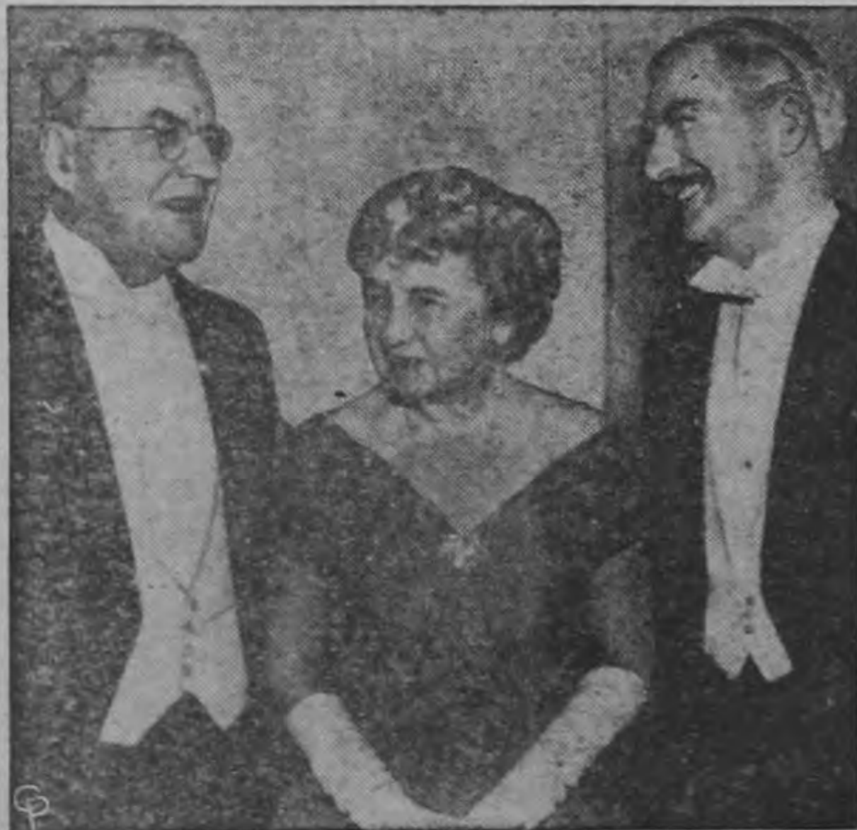
El Primer Ministro británico Sir Anthony Eden y sus anfitriones el Secretario de Estado norteamericano John Foster Dulles y su esposa, aparecen en la Unión Panamericana en Washington donde se ofreció una comida en honor de Eden. El estadista visitante se encuentra en los Estados Unidos para una serie de conferencias de alto nivel con el Presidente Eisenhower y Dulles.