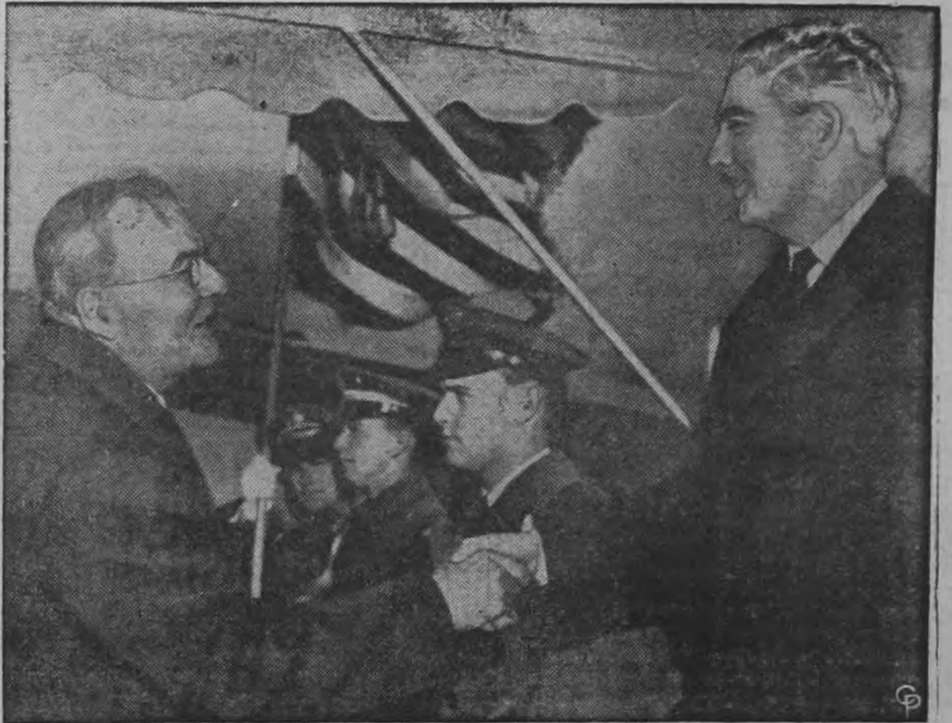
Con una guardia de honor al fondo, el Secretario de Estado John Foster Dulles de los Estados Unidos extiende su mano en señal de bienvenida al Primer Ministro Británico, Sir Anthony Eden, a su llegada a Washington para sus conferencias con el Presidente Eisenhower.