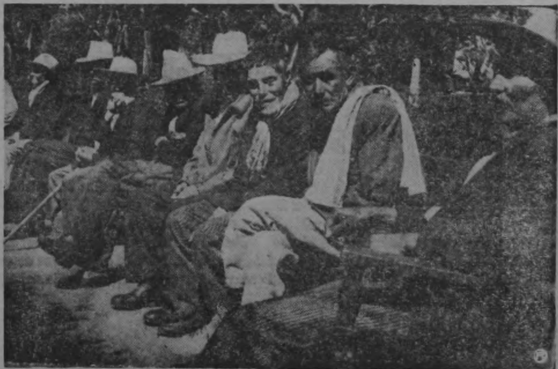
MANSEDUMBRE Y SOL.—Los viejecitos del Asilo de Ancianos de Cartago, reciben el sol como una bendición, mientras en la mansedumbre de sus gestos se refleja el candor y la resignación.