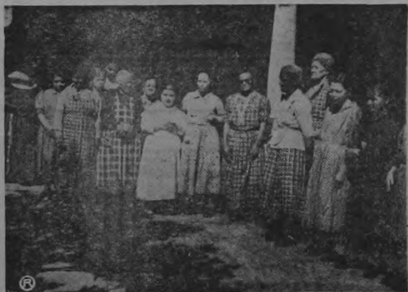
PABELLON DE MUJERES.—Las graciosas viejecitas del Asilo, aparecen en el pabellón que se les ha destinado, con una confianza en su vejez, de la que ellas han hecho su fortaleza y su escudo.