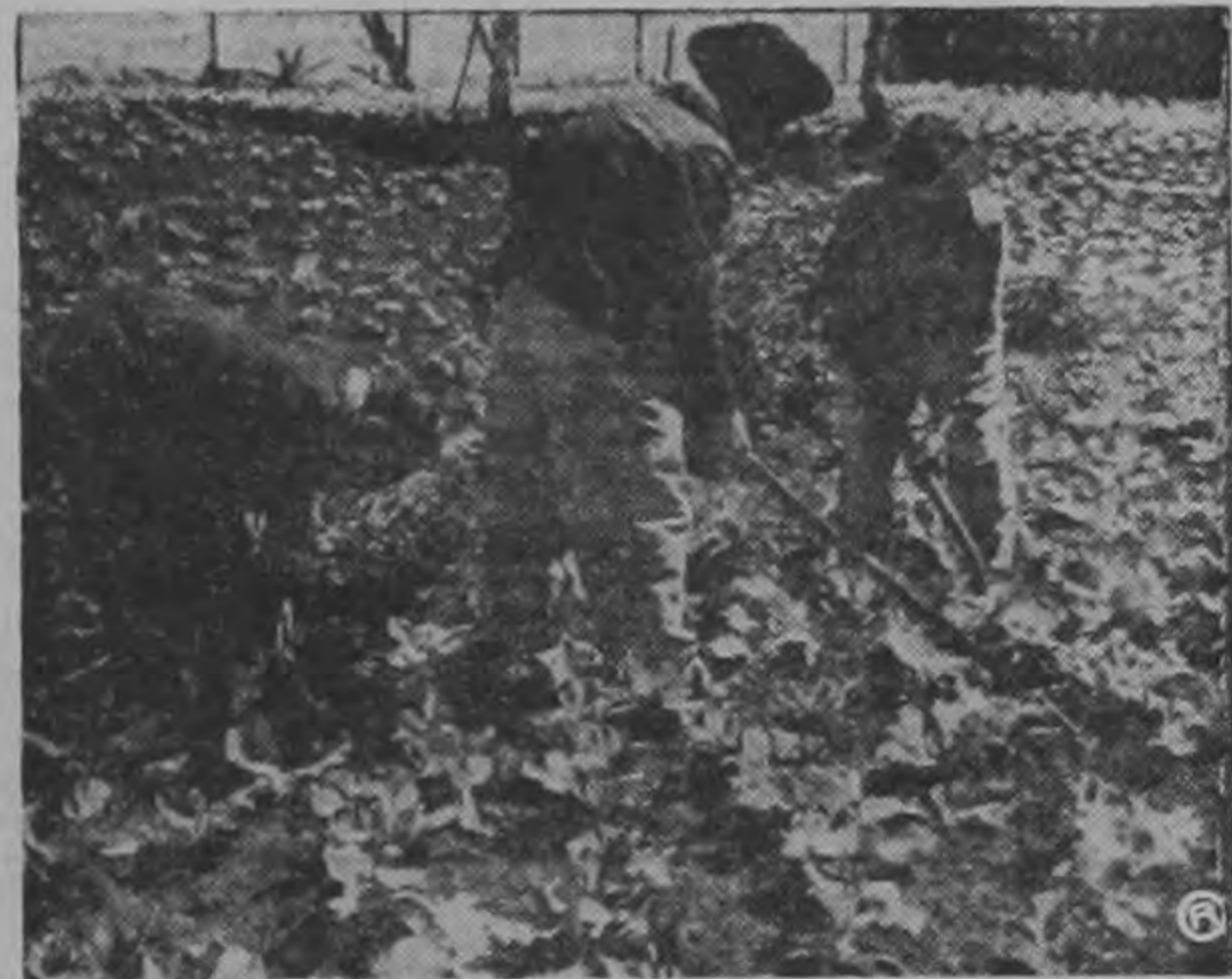
EN LAS FAENAS DEL HUERTO.—Los ancianos se distraen laborando en el huerto y esperando con resignación benedictina que la tierra que se abre para la simiente, un día los acoja a ellos en su seno.